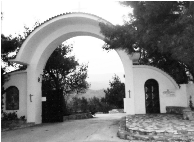
Η είσοδος στο Λύρειο Παιδικό Ίδρυμα

Το Δ.Σ. του Συλλόγου Μακισταίων εκ μέρους των μελών του, εκφράζει την οδύνη του για τους συνανθρώπους μας που χάθηκαν στις πρόσφατες πυρκαγιές της 23ης Ιουλίου 2018 στο Μάτι και Ν. Βουτζά Αττικής .