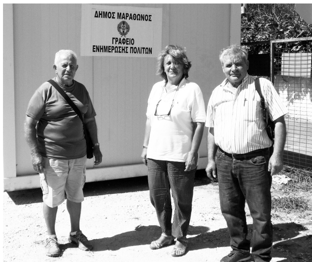
Ο Πρόεδρος του Συλλόγου και ο Ταμίας με την υπεύθυνη του Δήμου Μαραθώνος στις φωτιές της Αττικής

Κατά την επίσκεψή μας εκεί διαπιστώσαμε την τραγική κατάσταση που βρίσκεται ο τόπος και ευχόμεστε να επουλωθούν οι πληγές το συντομότερο δυνατόν. Πέρασαμε και από το “ Λύρειο Παιδικό Ίδρυμα ” που λειτουργεί από το 1967 και συντηρεί 45 παιδιά (τώρα φιλοξενούνται σε άλλο χώρο). Οι καταστροφές που διαπιστώσαμε είναι πολύ μεγάλες ( σχολείο, γραφεία, σπίτια των παιδιών, αποθήκες, ελιές, αμπέλια κ.λπ. ), όλα μεσ’ την στάχτη.