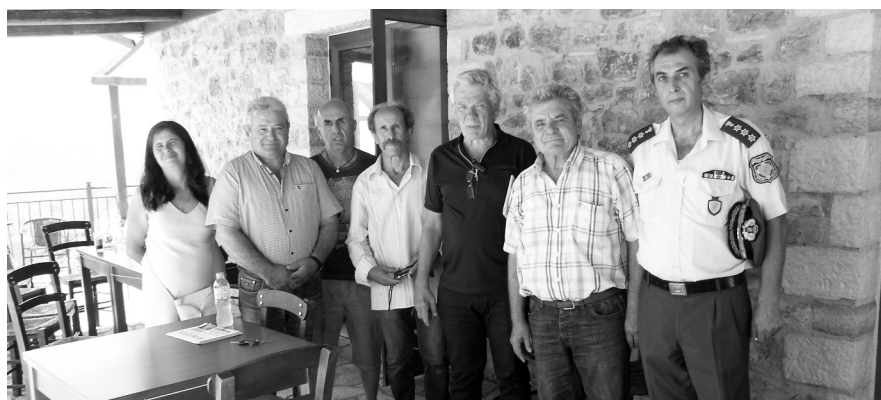
Ο Βουλευτής κ. Μάκης Μπαλαούρας εν μέσω συμπατριωτών μας μετά το μνημόσυνο

Όπως κάθε χρόνο, έτσι και φέτος, στις 24 Αυγούστου 2018 έγινε το μνημόσυνο των αδικοχημένων συνανθρώπων μας στην στροφή της Αρτέμιδας, στα εικονοστάσια και στο εκκλησάκι. Το απόγευμα, με την παρουσία του Μητροπολίτη μας κ.κ. Χρυσόστομου και το πρωί στις 10:00 με το άγημα του Πυροσβεστικού Σώματος. Εκεί