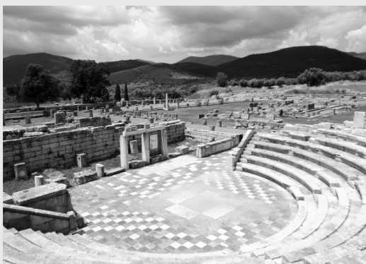
Το μικρό Αρχαίο Θέατρο Μεσσήνης (Εκκλησιαστήριο)

Μιας ειδικής μορφής αξιώσεις κυριότητας επί του αρχαιολογικού χώρου της αρχαίας Μεσσήνης εκφράστηκαν προ ετών από κατοίκους του δημοτικού διαμερίσματος του Μαυροματιού Ιθώμης (που τελείως αδικαιολόγητα μετονομάστηκε το 2004 σε αρχαία Μεσσήνη), το οποίο βρίσκεται μέσα στα όρια του αρχαιολογικού χώρου. Αφορμή στάθηκε η χωροθέτηση ενός σύγχρονου νέου Μουσείου έξω από τα τείχη της αρχαίας πόλης, νότια του Σταδίου και όχι σε θέση της προτίμησής τους, πλησιέστερα στο χωριό τους. Αναρτήθηκαν σημαίες από μαύρο πλαστικό σε καίρια σημεία του χωριού, καθώς και μεγάλα πανό με συνθήματα, μεταξύ των οποίων ξεχώριζε το “κάτω τα χέρια από τα αρχαία μας” .