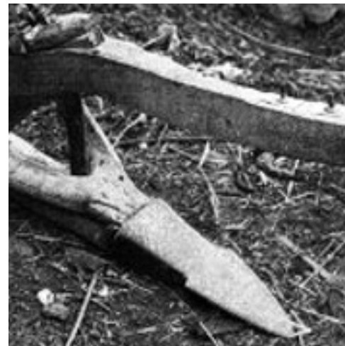
Το ξύλινο αλέτρι

διαβόλοι! Αγανακτούσαν και οργίζονταν εκείνες. Πολλές φορές τα τιμωρούσαν ραβδίζοντάς τα στα πισινά. Μα αυτά, (τα πισινά), ήταν προστατευμένα από την πολύπτυχη, -από τα πολλά μπαλώματα, - υφασματική ασπίδα (το παντελόνι) και δεν προκαλούσαν πόνους οι ξυλιές ή τα χειροκτυπήματα με τη χειροπαλάμη που κάναν οι περισσότερες μανάδες.