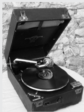
Γραμμόφωνο Columbia του 1928

Οι πρώτοι δίσκοι, 1895-1927 προέρχονταν από τους Έλληνες της Αμερικής, της Κωνσταντινούπολης και της Σμύρνης.