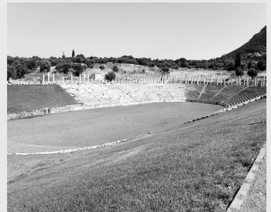
Το Αρχαίο Στάδιο Μεσσήνης

δων ετών αναμνήσεις και παραδόσεις για το παρελθόν και “τα μνημεία τους” , αποτελούν και αυτοί μέρος μιας μακρόχρονης ιστορίας μετακινήσεων και μεταναστεύσεων.