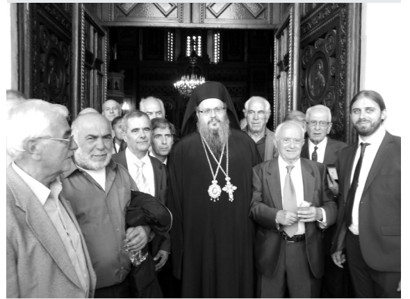
Ο συμπατριώτης μας Μητροπολίτης Λαρίσης και Τυρνάβου κ.κ. Ιερώνυμος Νικολόπουλος εν μέσω συγγενών του και συμπατριωτών μας την ημέρα της χειροτονίας του

Με λαμπρότητα τελέστηκε στις 7 Οκτωβρίου 2018 η χειροτονία του Μητροπολίτη Λαρίσης και Τυρνάβου κ. Ιερωνύμου στον Ιερό Μητροπολιτικό Ναό Ευαγγελισμού της Θεοτόκου Αθηνών.