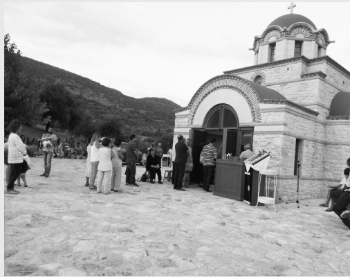
Η εκκλησία την ημέρα των εγκαινίων

Στις συζητήσεις για το σχέδιο είχε αποφασιστεί να κτιστεί ναός με τρούλο και όχι με απλή δίριχτη στέγη. Η επιθυμία ήταν να δημιουργηθεί ενιαίος χώρος όπου θα τονίζεται ο κεντρικός κατακόρυφος