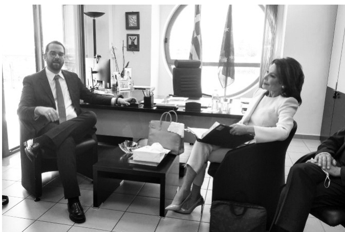
Η Πρόεδρος της Επιτροπής «Ελλάδα 2021» σε συνάντηση με τον Περιφερειάρχη κ. Νεκτάριο Φαρμάκη

Επιτροπής 2021 εστίασε στον ρόλο που διαδραμάτισε η περιοχή στην Ελληνική Επανάσταση και ανέφερε ότι έχει ήδη μελετήσει τη σπουδαία προετοιμασία που έχει γίνει στην Περιφέρεια Δυτικής Ελλάδας στο επίπεδο της συγκέντρωσης και ιεράρχησης των προτάσεων για τον Εορτασμό του 2021.