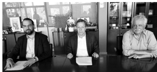
Από αριστερά ο Περιφερειάρχης Δυτικής Ελλάδας κ. Νεκτάριος Φαρμάκης, ο Δήμαρχος Αρχαίας Ολυμπίας κ. Γιώργος Γεωργιόπουλος και ο κ. Σταύρος Μπένος στις 17 Ιουλίου 2020 στην Αρχαία Ολυμπία