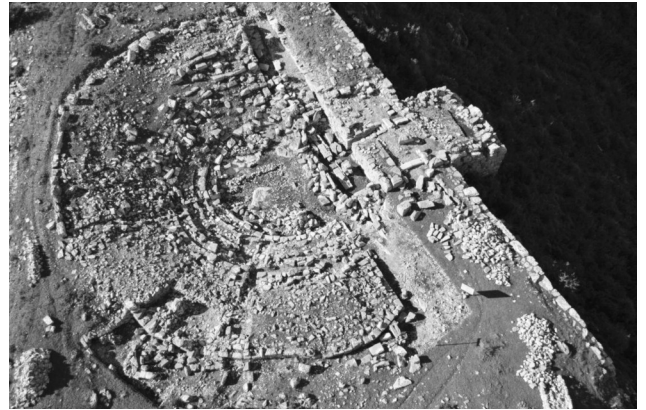
Το Αρχαίο Θέατρο μετά την ανασκαφή το 2015

ΜΕΓΑΡΟ ΜΟΥΣΙΚΗΣ 8-5-2018 ΤΟ ΑΡΧΑΙΟ ΘΕΑΤΡΟ ΠΛΑΤΙΑΝΑΣ ΚΟΜΒΙΚΟ ΣΗΜΕΙΟ ΕΠΙΣΚΕΨΗΣ ΤΗΣ ΠΟΛΙΤΙΣΤΙΚΗΣ ΔΙΑΔΡΟΜΗΣ «ΟΛΥΜΠΙΑ ΟΔΟΣ»