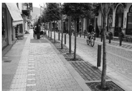
Το κέντρο του Καρπενησίου μετά