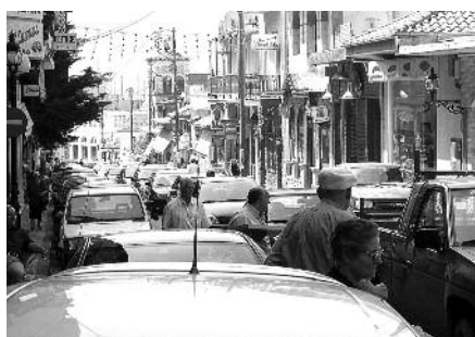
Το κέντρο του Καρπενησίου πριν