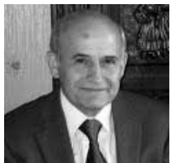
Γράφει ο Αγαθοκλής Παναγούλιας

Σύντομη αναφορά Με Διάταγμα της Βουλής στις 27 Δεκεμβρίου 1871 προκηρύχθηκαν βουλευτικές εκλογές οι οποίες έγιναν στην 26 Φεβρουαρίου 1872 από την Κυβέρνηση Δημ. Βούλγαρη. Το σχετικό διάταγμα δημοσιεύτηκε στο ΦΕΚ 55/23.12.1871